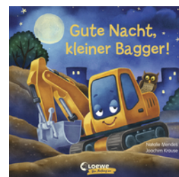
Gute Nacht, kleiner Bagger!