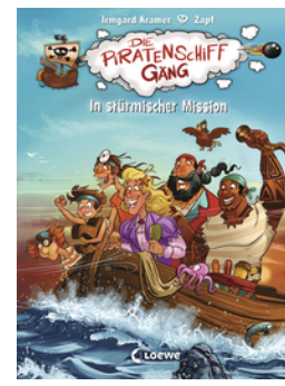
Die Piratenschiffgänger 3 - In stürmischer Mission