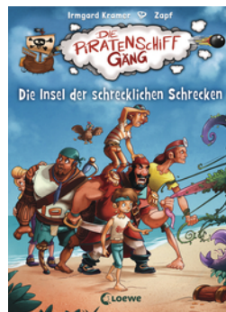
Die Piratenschiffgänger 2 - Die Insel der schrecklichen Schrecken