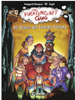
Die Piratenschiffgänger 4 - Der Schatz des Tschupa Tschupa