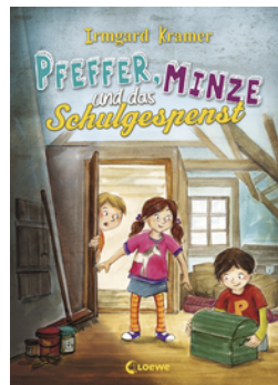
Pfeffer, Minze und das Schulgespenst