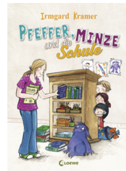
Pfeffer, Minze und die Schule