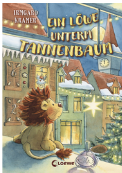
Ein Löwe unterm Tannenbaum