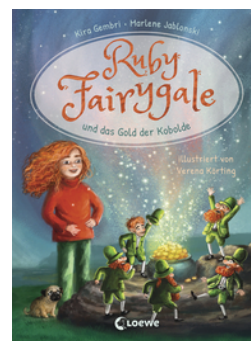
Ruby Fairygale und das Gold der Kobolde (Erstlese-Reihe, Band 3)