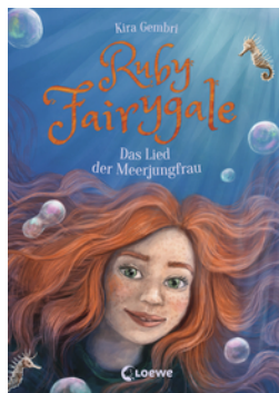
Ruby Fairygale (Band 7) - Das Lied der Meerjungfrau