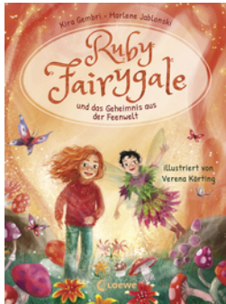
Ruby Fairygale und das Geheimnis aus der Feenwelt (Erstlese-Reihe, Band 2)