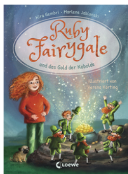
Ruby Fairygale und das Gold der Kobolde (Erstlese-Reihe, Band 3)