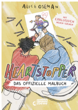
Heartstopper - Das offizielle Malbuch