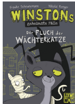
Winstons geheimste Fälle (Band 1) - Der Fluch der Wächterkatze