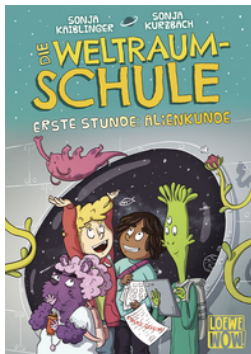
Die Weltraumschule (Band 1) - Erste Stunde: Alienkunde