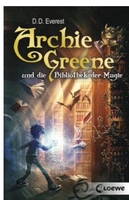
Archie Greene und die Bibliothek der Magie (Band 1)