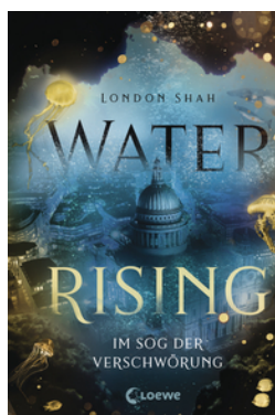
Water Rising (Band 2) - Im Sog der Verschwörung