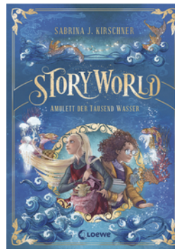
StoryWorld (Band 1) - Amulett der Tausend Wasser