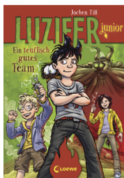
Luzifer junior (Band 2) - Ein teuflisch gutes Team