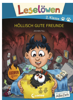
Leselöwen 2. Klasse - Höllisch gute Freunde (Großbuchstabenausgabe)