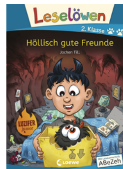
Leselöwen 2. Klasse - Höllisch gute Freunde