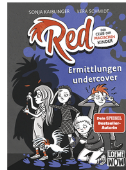
Red - Der Club der magischen Kinder (Band 2) - Ermittlungen undercover