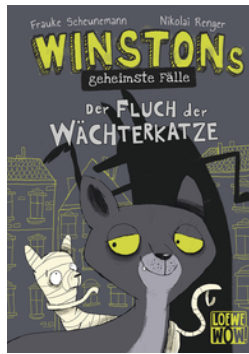
Winstons geheimste Fälle (Band 1) - Der Fluch der Wächterkatze