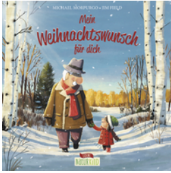
Mein Weihnachtswunsch für dich