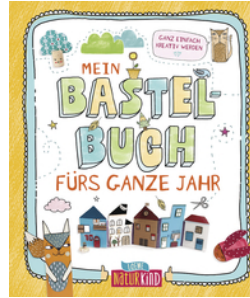
Mein Bastelbuch fürs ganze Jahr