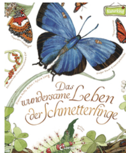
Das wundersame Leben der Schmetterlinge