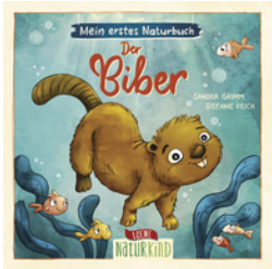
Mein erstes Naturbuch - Der Biber