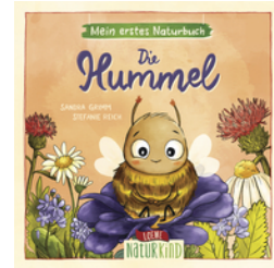
Mein erstes Naturbuch - Die Hummel