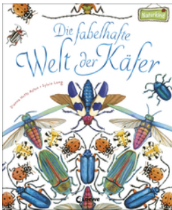
Die fabelhafte Welt der Käfer