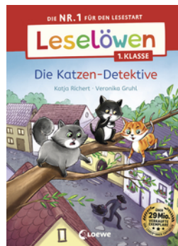
Leselöwen 1. Klasse - Die Katzen-Detektive