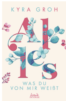
Alles, was du von mir weißt (Alles-Trilogie, Band 2)