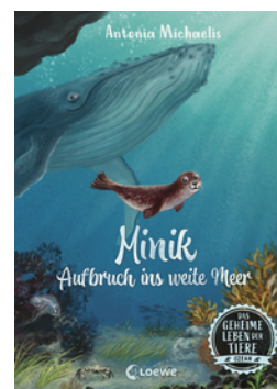
Das geheime Leben der Tiere (Ozean) - Minik - Aufbruch ins weite Meer