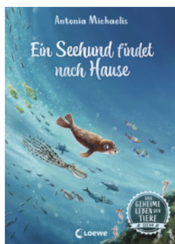
Das geheime Leben der Tiere (Ozean) - Ein Seehund findet nach Hause