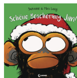
Schöne Bescherung, Jim!

... und 17 weitere Titel des Autors vorhanden.