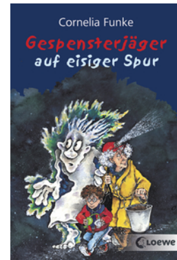
Gespensterjäger auf eisiger Spur