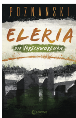
Eleria (Band 2) - Die Verschworenen