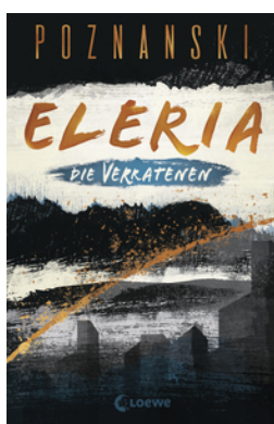
Eleria (Band 1) - Die Verratenen