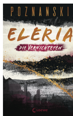
Eleria (Band 3) - Die Vernichteten