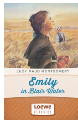
Emily in Blair Water