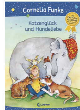
Katzenglück und Hundeliebe