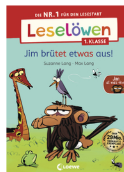
Leselöwen 1. Klasse - Jim ist mies drauf - Jim brütet etwas aus!