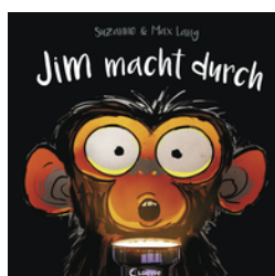
Jim macht durch