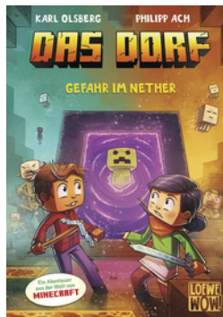
Das Dorf (Band 2) - Gefahr im Nether