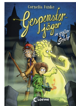
Gespensterjäger in großer Gefahr