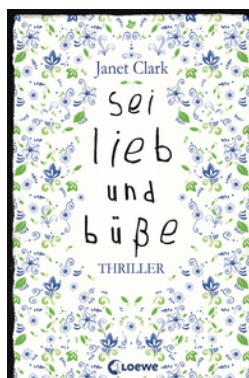
Sei lieb und büße