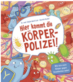
Hier kommt die Körperpolizei!