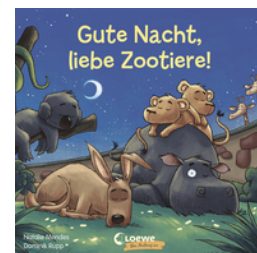
Gute Nacht, liebe Zootiere!