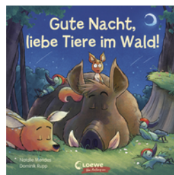
Gute Nacht, liebe Tiere im Wald!