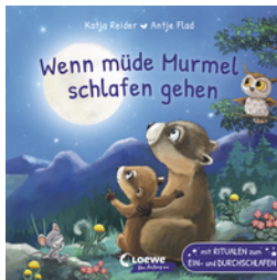
Wenn müde Murrel schlafen gehen