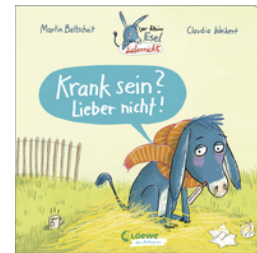
Der kleine Esel Liebernicht - Krank sein? Lieber nicht!