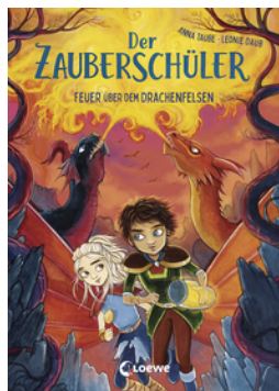
Der Zauberschüler (Band 6) - Feuer über dem Drachenfelsen