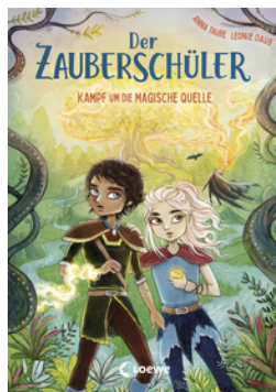
Der Zauberschüler (Band 4) - Kampf um die Magische Quelle