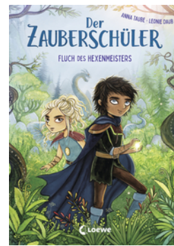
Der Zauberschüler (Band 1) - Fluch des Hexenmeisters