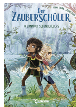
Der Zauberschüler (Band 2) - Im Bann des Seeungeheuers