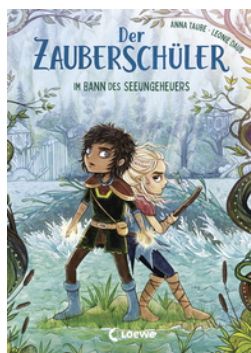
Der Zauberschüler (Band 2) - Im Bann des Seeungeheuers