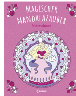
Magischer Mandalazauber - Prinzessinnen