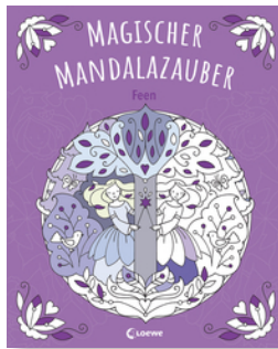
Magischer Mandalazauber - Feen