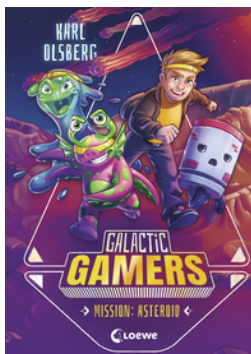
Galactic Gamers (Band 2) - Mission: Asteroid