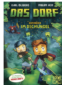
Das Dorf (Band 3) - Gefangen im Dschungel