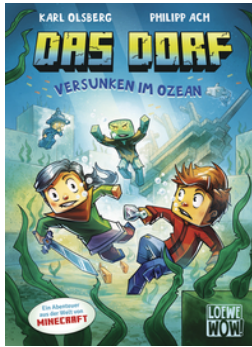
Das Dorf (Band 5) - Versunken im Ozean