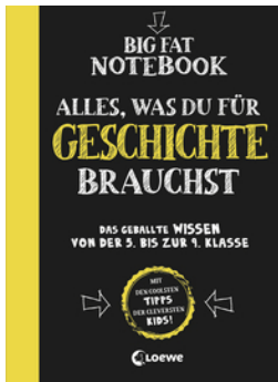
Big Fat Notebook - Alles, was du für Geschichte brauchst