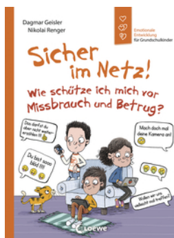
Sicher im Netz! Wie schütze ich mich vor Missbrauch und Betrug? (Starke Kinder, glückliche Eltern)