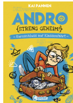
Andro, streng geheim! (Band 3) - Kurzschluss auf Klassenfahrt