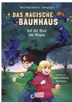
Das magische Baumhaus (Comic-Buchreihe, Band 5) - Auf der Spur der Ninjas