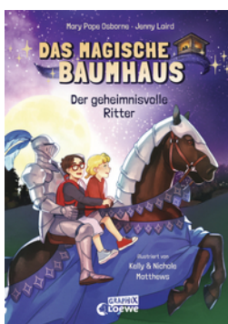
Das magische Baumhaus (Comic-Buchreihe, Band 2) - Der geheimnisvolle Ritter