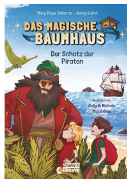
Das magische Baumhaus (Comic-Buchreihe, Band 4) - Der Schatz der Piraten