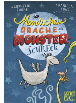
Mondscheindrache und Monsterschreck