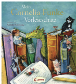
Mein Cornelia-Funke- Vorleseschatz