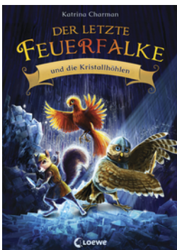
Der letzte Feuerfalke und die Kristalhöhlen (Band 2)