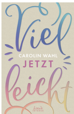
Vielleicht jetzt (Vielleicht-Trilogie, Band 1)