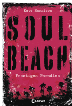
Soul Beach (Band 1) – Frostiges Paradies