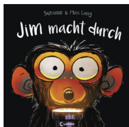
Jim macht durch