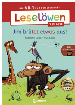
Leselöwen 1. Klasse - Jim ist mies drauf - Jim brütet etwas aus!