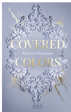
Covered Colors (Golden Hearts, Band 2)