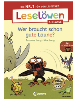
Leselöwen 1. Klasse - Jim ist mies drauf - Wer braucht schon gute Laune?