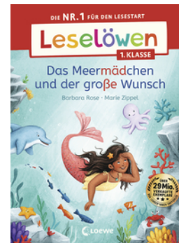
Leselöwen 1. Klasse - Das Meer mädchen und der große Wunsch