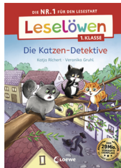
Leselöwen 1. Klasse - Die Katzen-Detektive