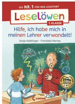
Leselöwen 1. Klasse - Hilfe, ich habe mich in meinen Lehrer verwandelt!