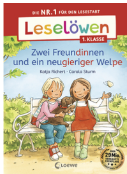
Leselöwen 1. Klasse - Zwei Freundinnen und ein neugieriger Welpe