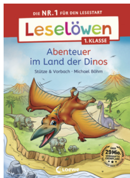
Leselöwen 1. Klasse - Abenteuer im Land der Dinos