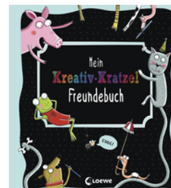
Mein Kreativ-Kratzel Freundebuch