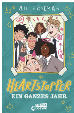
Heartstopper - Ein ganzes Jahr (Yearbook)