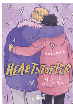
Heartstopper Volume 4 (deutsche Ausgabe)