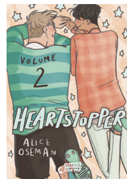
Heartstopper Volume 2 (deutsche Ausgabe)