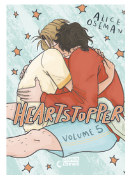
Heartstopper Volume 5 (deutsche Hardcover-Ausgabe)