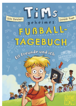
Tims geheimes Fußball- Tagebuch (Band 1) - Elf Freunde und ich!