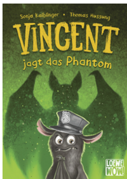
Vincent jagt das Phantom (Band 5)