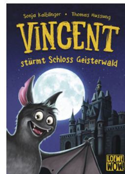
Vincent stürmt Schloss Geisterwald (Band 4)