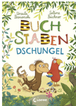
Buchstaben im Dschungel