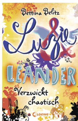
Luzie & Leander - Verzwickt chaotisch