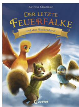
Der letzte Feuerfalke und das Wolkenland (Band 7)