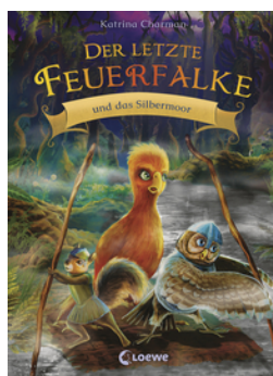
Der letzte Feuerfalke und das Silbermoor (Band 8)