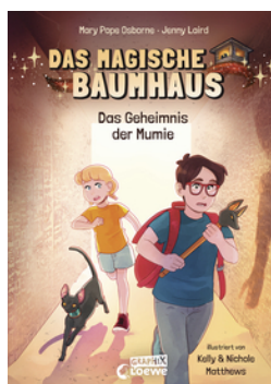
Das magische Baumhaus (Comic-Buchreihe, Band 3) - Das Geheimnis der Mumie