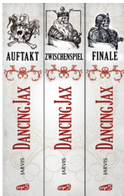
Dancing Jax - Die komplette Trilogie