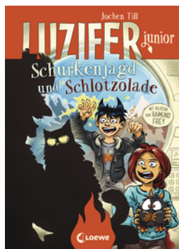
Luzifer junior (Band 14) - Schurkenjagd und Schlotzolade