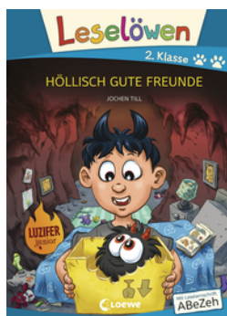
Leselöwen 2. Klasse - Höllisch gute Freunde (Großbuchstabenausgabe)