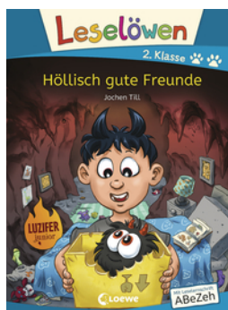
Leselöwen 2. Klasse - Höllisch gute Freunde