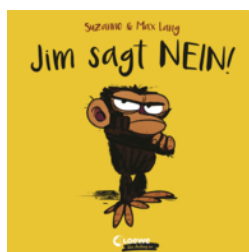
Jim sagt Nein!